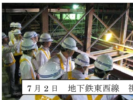
7月2日 地下鉄東西線 視察