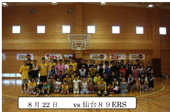
8月22日 vs 仙台89ERS