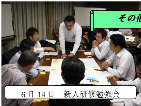
6月14日 新人研修勉強会