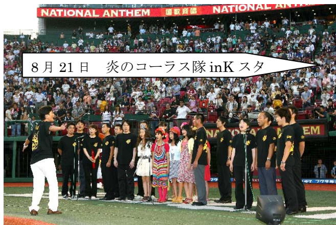
8月21日 炎のコーラス隊 inK スタ