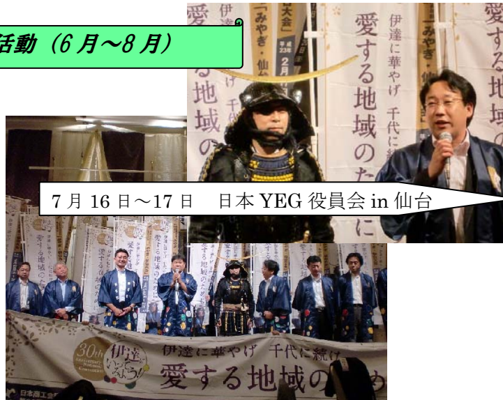
7月16日~17日 日本 YEG 役員会 in 仙台