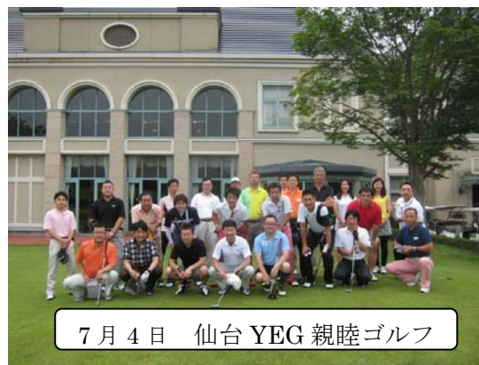
7月4日 仙台 YEG 親睦ゴルフ