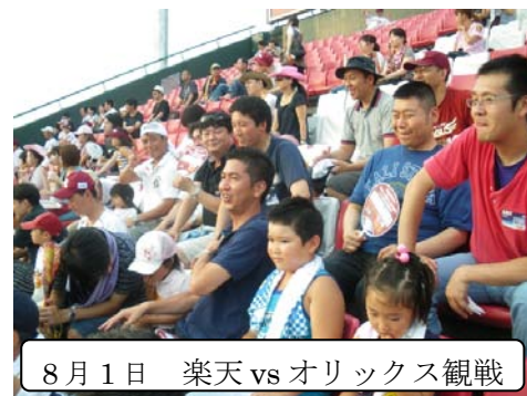
8月1日 楽天 vs オリックス 観戦